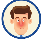
ಮೂಗಿನ ಸುತ್ತಲಿನ ಜಾಗ