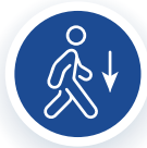
ചലന പരിധി കുറയൽ