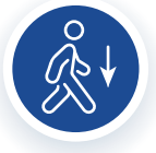
ಚಲನೆಯ ಸರಣಿ ಕಡಿಮೆಯಾಗುವುದು